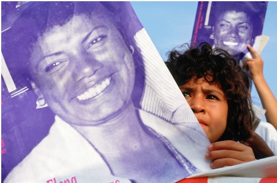
Niña portando una fotografía de María Elena Moyano en su funeral, 17 de febrero 1992.

de la manera frontal que Moyano proponía. 4 Al día siguiente del paro armado, un escuadrón de aniquilamiento de Sendero Luminoso emboscó a Moyano mientras participaba, junto con sus dos hijos, en un evento comunal para recaudar fondos. Ella encaró a quienes la asesinarían y pidió a sus hijos que voltearan sus rostros para que no presenciasen el fin que veía venir. Luego de dispararle, sus asesinos colocaron bajo su cuerpo cartuchos de dinamita, eliminándola físicamente en un brutal despliegue de violencia.