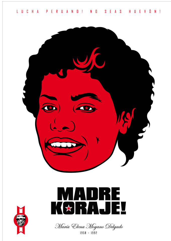
“MARIA ELENA MOYANO; colección: SUPERHEROES DE LA PATRIA año 2008” © Cherman 2008. dibujo vektorial impreso serigrafikamente en papel de algodón, formato 50 x 70 cms.

enfrentarse con Sendero es un motivo para celebrar su memoria, resalta su rol de luchadora social: “[Moyano es] una mujer de bandera, una mujer que para mí reivindica también la voluntad de la lucha por los valores sociales, por el honor, por su tierra... por su patria.” 64 En la imagen artística de Cherman, como en la intervención de Mauricio Delgado, el énfasis no está en la muerte de Moyano ni en su estatus de víctima, sino en la reivindicación de su rol de luchadora social y, en el caso de Cherman, de héroe o ícono nacional.