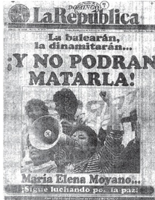
Carátula del diario La República al día siguiente del asesinato de María Elena Moyano, 16 de febrero de 1992.

ilusorias: aún cuando su asesinato era repudiado por amplios sectores de la sociedad peruana y por los medios de comunicación nacionales e internacionales, Sendero Luminoso había logrado en buena medida el efecto buscado de infundir miedo entre los activistas de base. Más aún, apenas semanas después de su asesinato, Fujimori anunció su autogolpe, el cual fue seguido por severas medidas de mano dura y la imposición de un Estado de sitio.